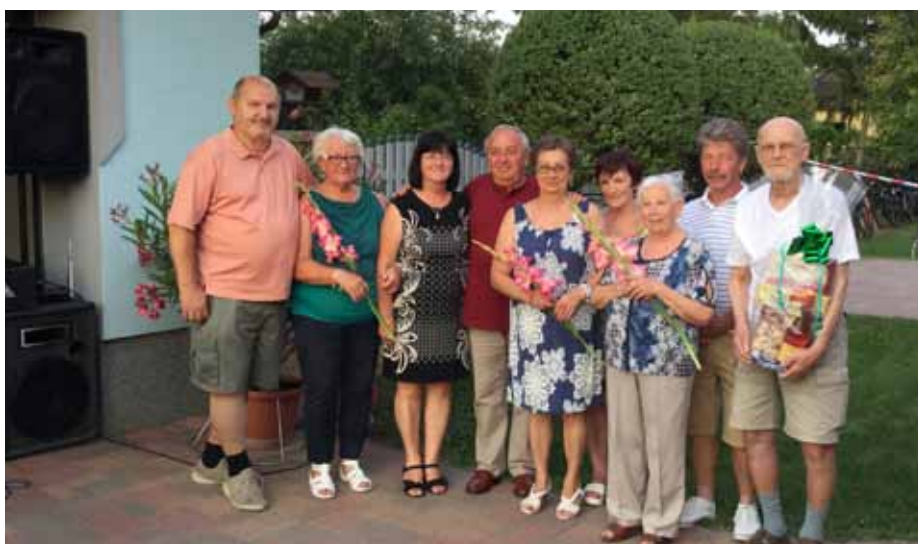
A Sallai utca hagyományos utcabáljának szervezői