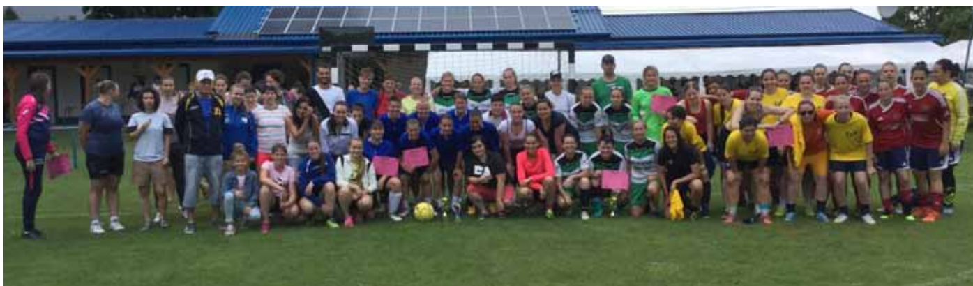
Kétnapos női focitorna