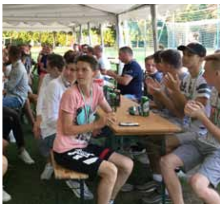
A DKSE évzáró ünnepsége