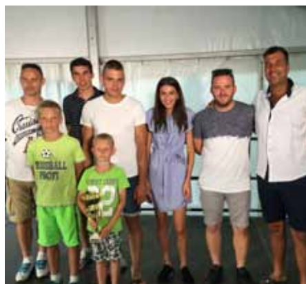
A falunapi utcabajnokság győztes csapata