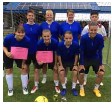
A női focitorna győztes csapata